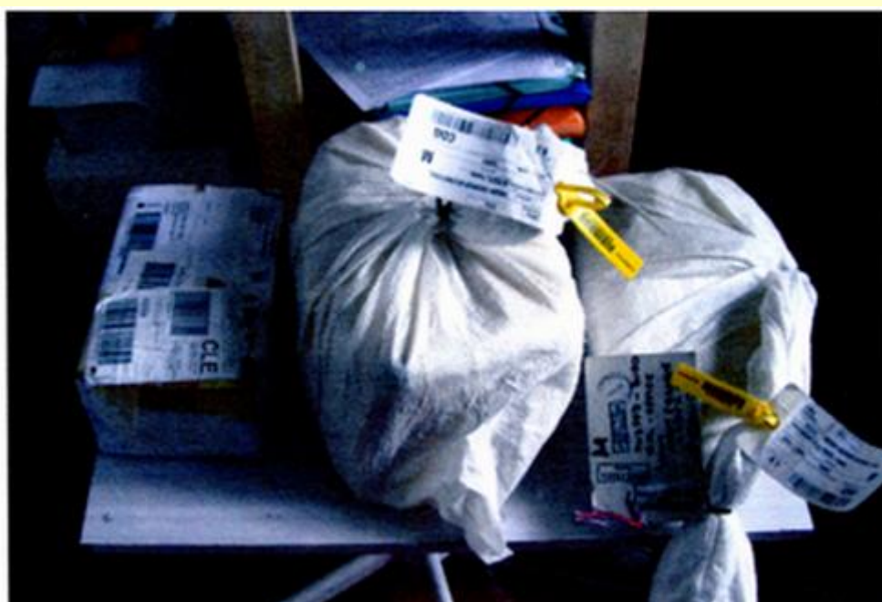
Arrivée cette semaine 40Kg de QSL de Bureaux Etrangers