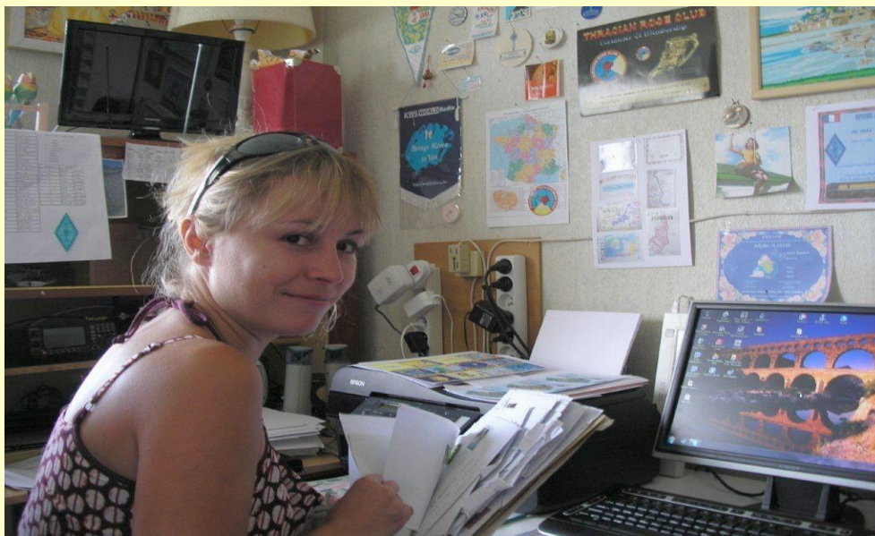
Directrice du Service QSL F-20711

QSL reçues de l'Etranger 40Kg QSL envoyées 425