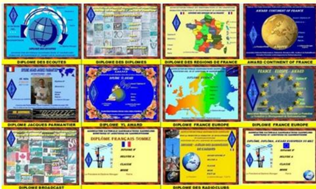
Diplôme collection F-20710 - : Diplôme de GB3AE European Award 2006

Nos Diplômes : http://www.radioamateurs.news.sciencesfrance.fr/?page_id=734