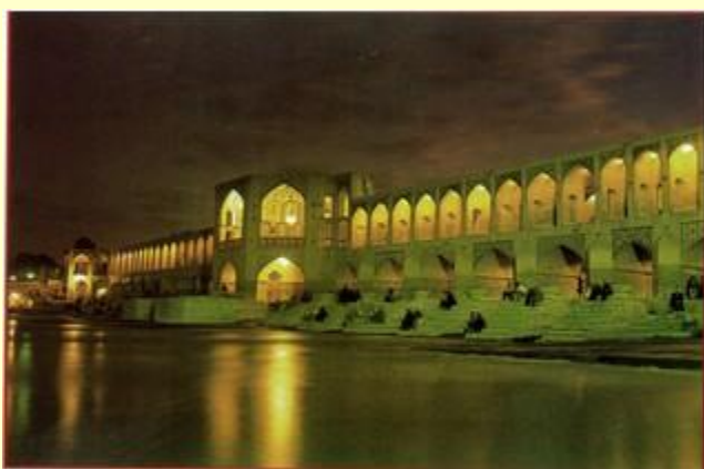
Pol-e Khajeh (Khaju Bridge) - Esfahan / 17th century

QSL collection F-20710: QSL de Mauritanie FF7AG